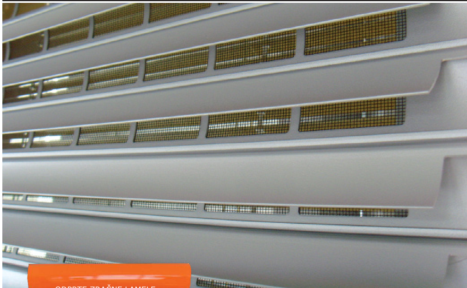
ODPRTE ZRAČNE LAMELE